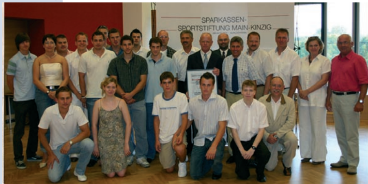
Die Handball-Abteilung des TV Gelnhausen wurde für ihre erfolgreiche Jugendarbeit mit dem Dr.-Harald-Schmid-Preis geehrt. Auf unserem Bild freuen sich Vertreter der TVG-Handballabteilung mit den Honoratioren.

>hqrbiib Fkcl o j ^qf l k bk) Qo^f k f k d p w b f q b k r k a >k p m o b `e m ^o q b o _f q q b r k q b o ! t t t +q s d b i k e ^r p b k *e ^k a _^i i +a b ! b o c o ^d b k +