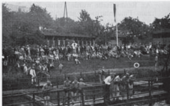
Die Schwimmer, 1927

1927 12. Jan. Jean Metzler wurde Turnwart der Frauenabteilung und verblieb in diesem Amt bis 1929. 2. - 4. Juli Besuch des Gauturnfestes in Lieblos. Erhöhte Wettkampfanforderungen. 2 Sieger im 12/ Kampf, 3 im 9/Kampf und die Musterriege. 10. Juli Gauschwimmfest in Gelnhausen.